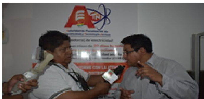
Instalación de Banner informativo sobre Reclamaciones