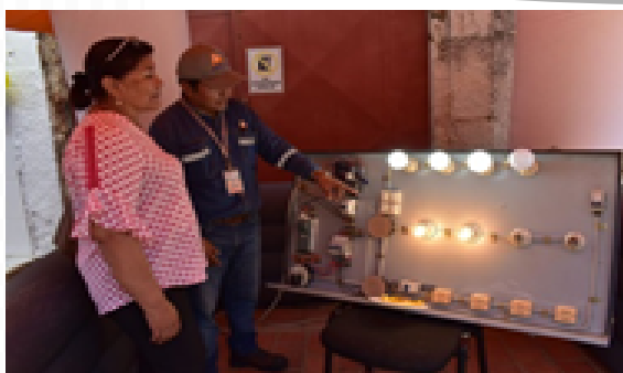
Difusión de derechos y obligaciones del consumidor del sector eléctrico.