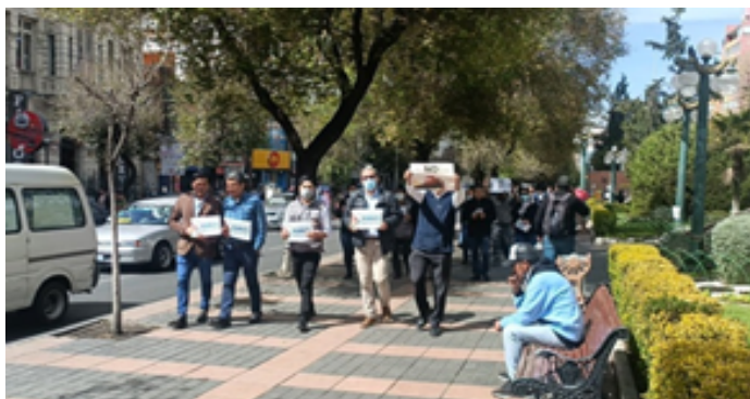
(La Paz 24-05-2023, Marcha contra el Racismo.

En el Día Nacional Contra el Racismo y Toda Forma de Discriminación en Bolivia, el personal de la oficina central y las oficinas regionales de la Autoridad de Fiscalización de Electricidad y Tecnología Nuclear (AETN) se sumaron a la gran movilización nacional contra el racismo y toda forma de discriminación bajo la consigna: "Todas las personas son iguales ante la ley".