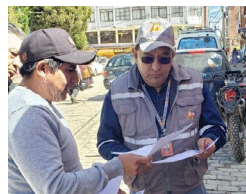
Copacabana, provincia Mako Kapac – La Paz, 10-05-2023