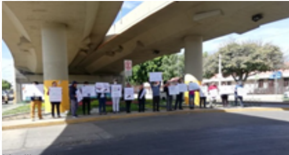
Movilización contra el Racismo (Cochabamba, 24-05-2023)