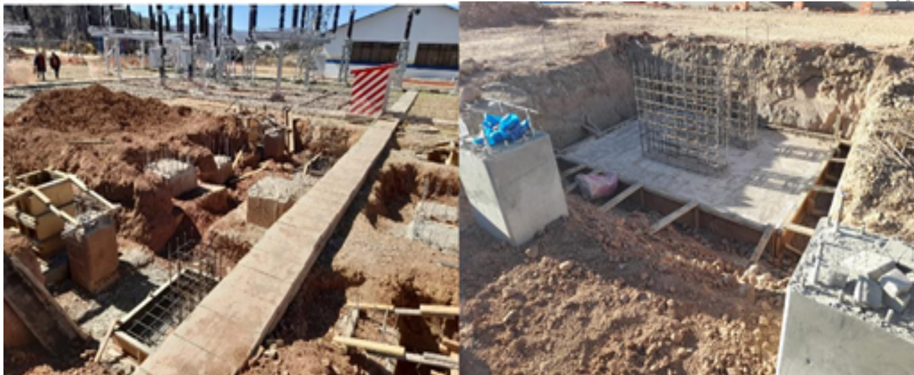
Presa Calachaka Jahuira, Excavación del canal temporal de desvío

E l proyecto comprende la instalación de una bahía 115 kV en configuración de anillo, incluyendo el sistema de barra trifásica, para la conexión de dos bahías de transformadores de potencia.