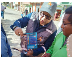
Huatajata, provincia Omasuyos, La Paz 03-05-2023