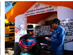
Corocoro, provincia Pacajes - La Paz, 29-05-2023