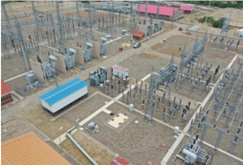
Sitio de emplazamiento del proyecto

El proyecto ejecutado por ENDE TRANSMISIÓN S.A. se encuentra en ejecución de la ingeniería del proyecto y presenta un avance general del 5,00% y tiene previsto su culminación para octubre de 2024.