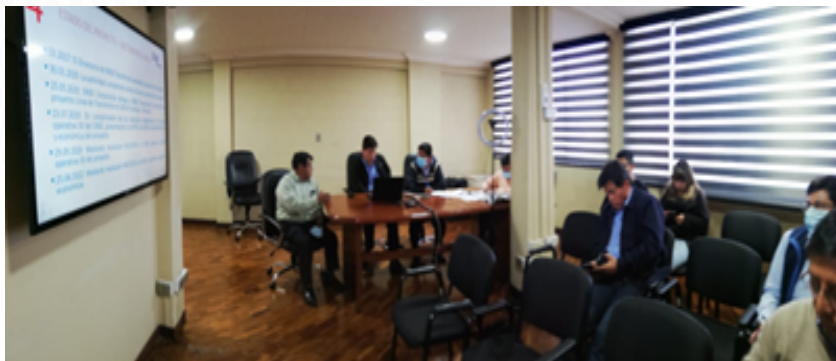
Reunión de seguimiento mensual