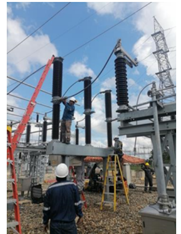
Actividades realizadas durante la inspección Administrativa