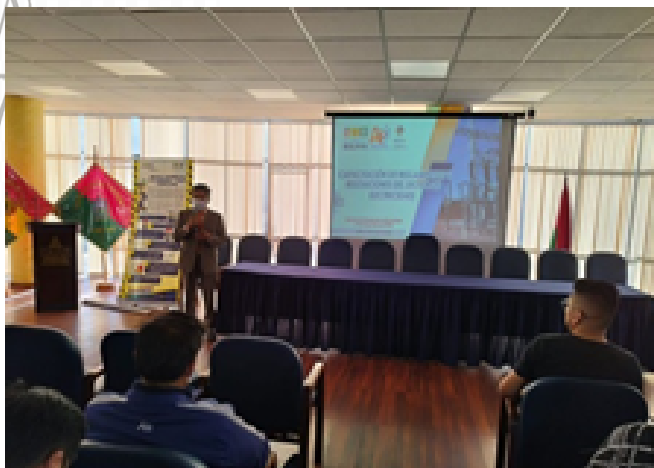
(La Paz 31-05-2023) Curso de capacitación: Operación y Calidad del suministro de electricidad

La Autoridad de Fiscalización de Electricidad y Tecnología Nuclear (AETN) actualizó conocimientos de trabajadores de la empresa ENDE Servicios y Construcciones S.A. (ENDE SyC S.A.) sobre la operación y calidad del suministro de electricidad, en el marco de la Ley de Electricidad N° 1604 y sus reglamentos, en un taller efectuado el 30 y 31 de mayo en la ciudad de La Paz.