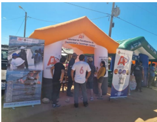
Feria Interinstitucional Multisectorial (Caragua, Santa Cruz 14-05-2023)

Personal técnico de la Autoridad de Fiscalización de Electricidad y Tecnología Nuclear (AETN), a invitación de las autoridades de la comunidad “San Isidro del Espino” perteneciente a la Capitanía Charagua Norte, del Gobierno Autónomo Indígena Originario Campesino Charagua Iyambae, participó en Feria Interinstitucional Multisectorial desarrollada en esa comunidad, de la provincia cordillera del departamento de Santa Cruz, el pasado 14 de mayo. Durante el evento el personal de la Oficina Regional Santa Cruz explicó a los pobladores los beneficios de descuento mensual del 25% en la factura por Tarifa Dignidad y el descuento del 20% para adultos mayores (en el consumo de los primeros 100kWh), Además de informar sobre los beneficios de la instalación de sistemas fotovoltaicos tras la implementación de la Generación Distribuida mediante el Decreto Supremo N° 4477.