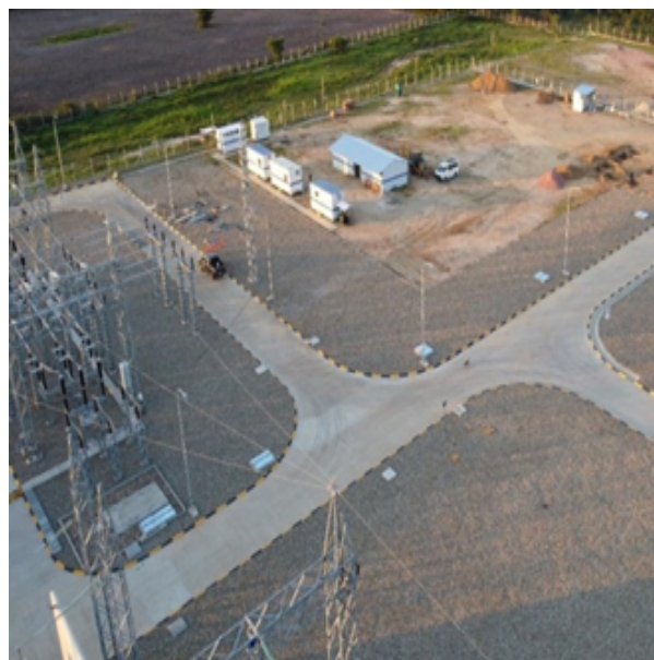
Estado Físico del Proyecto - Bahía de Transformador 115 kV - Subestación Paraíso

Por su parte, la Distribuidora ENDE DELBENI S.A.M. informó que gestiona la adjudicación de la bahía de 115kV y la contratación del servicio de traslado del transformador de Santa Cruz a la subestación Paraíso para su montaje. En relación a la construcción de la línea de media tensión, la Distribuidora informó que tienen tendidos los borVVnes flexibles, los equipos de maniobra y de medición, además gestiona la contratación para el montaje electromecánico y la adquisición de equipos de control y protección. La puesta en servicio del transformador y de los alimentadores está prevista para el mes de octubre de 2023.