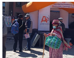
Huarina, provincia Omasuyos – La Paz 03-05-2023