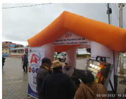
Puerto Pérez, provincia Los Andes – La Paz, 05-05-2023