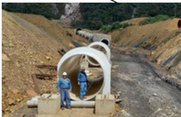
Proyecto Hidroeléctrico Ivirizu