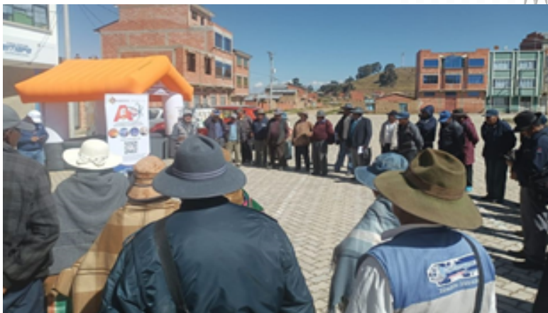
Chua Cocani, provincia Omasuyos – La Paz, 02-05-2023.

Utilizando un tablero eléctrico despertamos el interés y la expectativa de pobladores sobre los beneficios del uso de focos LED en reemplazo de los focos incandescentes, como el bajo consumo de energía eléctrica y una mejor iluminación en su hogar. Promoviendo la eficiencia energética informamos sobre los beneficios de la instalación de sistemas fotovoltaicos (generación distribuida) para la generación de energía eléctrica destinada al autoconsumo y el impulso del Gobierno Nacional al uso de vehículos eléctricos (electromovilidad) mediante el Decreto Supremo N°4539. La AETN precautela los derechos de usuarios y consumidores de los sectores de electricidad y tecnología nuclear.