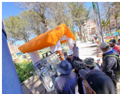
Achacachi, provincia Omasuyos - La Paz, 18-05-2023