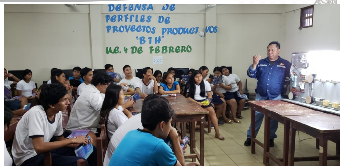
Difusión en Unidades Educativas de Trinidad.

Como parte de las actividades de control de calidad a la Distribuidora, el personal técnico del Ente regulador realizó más de mil verificaciones de lectura de medidores y más de 100 verificaciones a medidores en diferentes domicilios de la ciudad de Trinidad. Además de la supervisión a la instalación de Registradores para controlar la calidad del servicio eléctrico entregado por la Distribuidora ENDE DELBENI S.A.M.