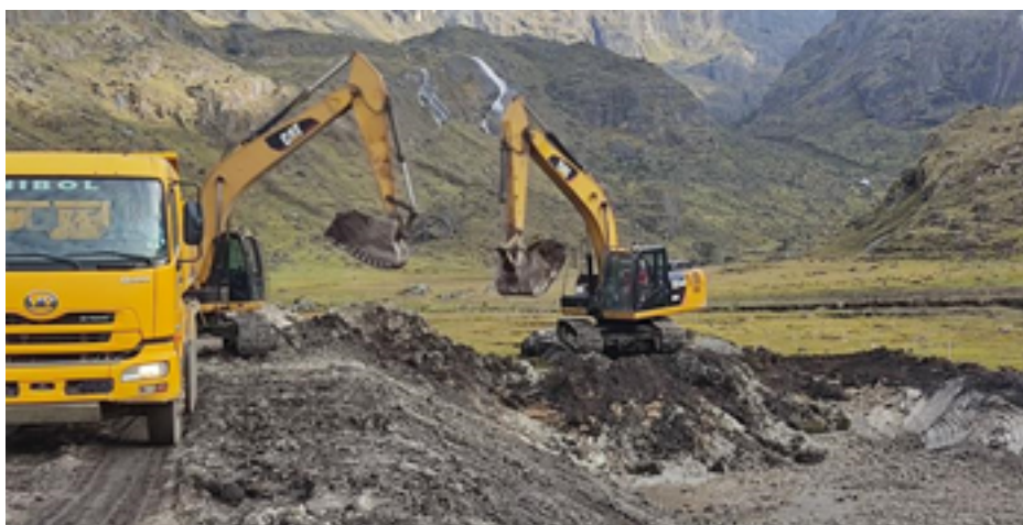
Presa Calachaka Jahuira, Excavación del canal temporal de desvío

La empresa ENDE tiene un avance global del 40.29%, previéndose su puesta a la fecha este proyecto en servicio para agosto de