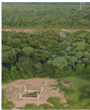
Sitio de construcción - Línea de transmisión

De acuerdo a ENDE TRANSMISIÓN S.A., el proyecto tiene un avance físico del 54,68 % y se prevé su entrada en operación para el mes de agosto de 2024. Actualmente la empresa trabaja en la liberación de servidumbres de paso de línea en un 37% de sitios de torre que