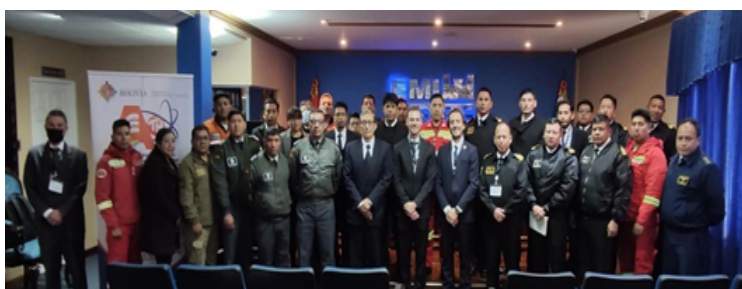
Taller: Arquitectura de Detección de Seguridad Física de Bolivia