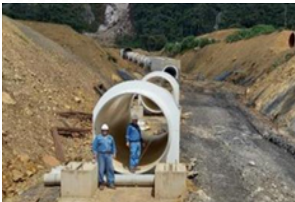
Actividades durante la inspección de la AETN - Proyecto Hidroeléctrico Ivirizu

La AETN presentó los resultados de la inspección “in situ” (en el lugar) que realizó el día 25 de mayo del 2023, informando que el proyecto está en proceso de construcción en varios frentes y que tiene un avance global de aproximadamente el 70%.