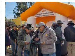
San Pedro de Tiquina, provincia Mako Kapac– La Paz, 11-05-2023