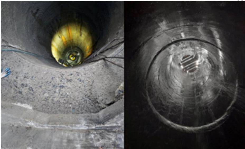
Finalización de Trabajos de revestimiento en el Pique Solitario

El proyecto Túnel Secundario - Proyecto Hidroeléctrico San José, prevé su ingreso en operación para el mes de junio de 2023.