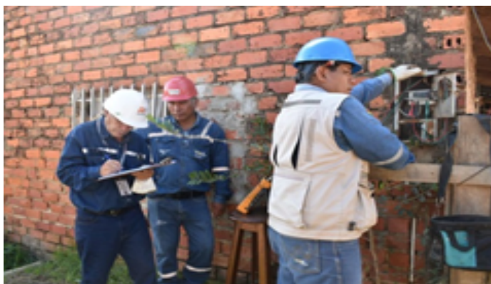
AETN fortalece control de calidad en Trinidad