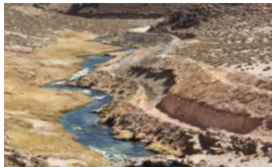
Sitio de emplazamiento – Central Hidroeléctrica El Cóndor

El “Proyecto Hidroeléctrico El Cóndor” consiste en la construcción de una central hidroeléctrica de media caída, que aprovecha las aguas del embalse de Aguas Calientes en la cuenca del Río Yura, la rehabilitación del embalse, una toma lateral un canal abierto, la construcción de desarenador, cámara de carga, tubería de presión y casa de máquinas con una potencia de 1,47kW.