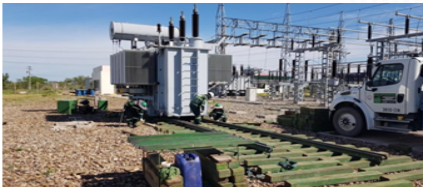
Sitio de emplazamiento del proyecto

Actualmente el proyecto se encuentra con la gestión regulatoria detenida a la espera que la empresa EMDEECRUZ regularice la aprobación de sus inversiones con la AETN. Por su parte, EMDEECRUZ informó que el segundo transformador está en pruebas de fábrica y que se tiene un retraso en la puesta en servicio del mismo, previéndose el inicio de las obras civiles para el mes de junio de 2023.