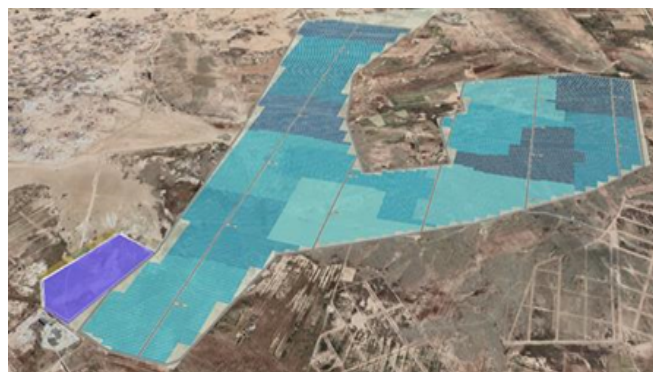
Vista de emplazamiento: Proyecto Planta Solar Vinto - 132 MW

ENDE Guaracachi informó sobre la presentación de estrategias de financiamiento al Ministerio de Hidrocarburos y Energías, el estado de avance de la ingeniería básica del proyecto y las gestiones legales para el cambio de nombre de los predios para la instalación de las plantas. El avance global de este proyecto a mayo de la presente gestión es del 25,8%. A través de estos proyectos fotovoltaicos ENDE Guaracachi generará desde el 2025 aproximadamente 270 MW de energía limpia y renovable, a través de la instalación de las plantas de Patacamaya (81 MW), Santivañez (63 MW) y Vinto Oruro (126 MW).