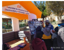
Calamarca, provincia Aroma -La Paz, 26-05-2023