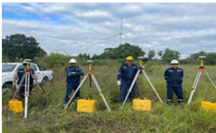
Actividades topológicas del proyecto – Parque Eólico Warnes II

R especto a la construcción del Parque Eólico Warnes II, la misma cuenta con la firma del contrato de suministro y construcción. Asimismo, la topología del proyecto se encuentra concluida, por lo que se prevé la puesta en servicio de este proyecto para diciembre de 2023.