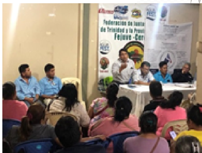
(Trinidad 22-05-2023) Reunión con organizaciones sociales de Trinidad

Por su parte, el director ejecutivo de la AETN socializó el derecho al reclamo de los Consumidores y los medios para la atención a la población e invito