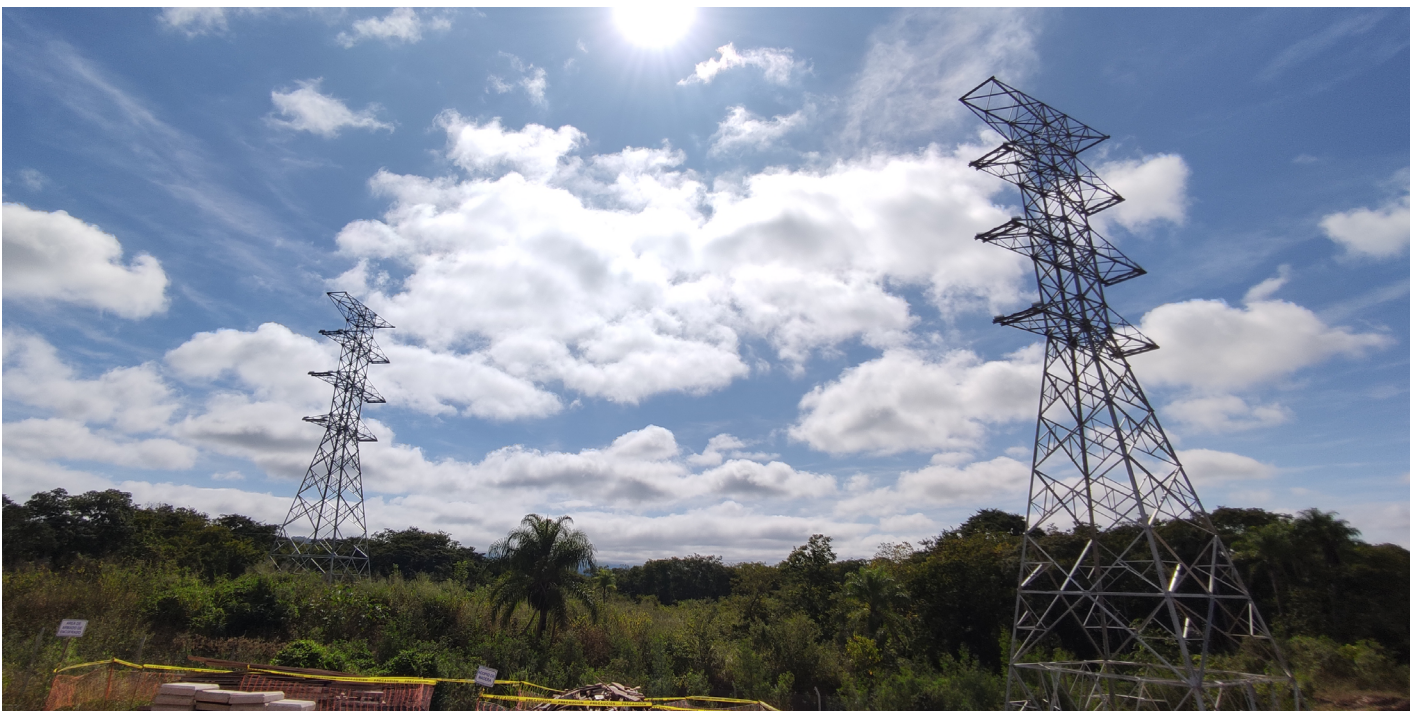
Línea de Transmisión subestación Bermejo, Tarija